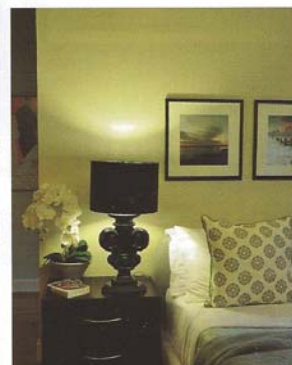
主人房設計以柔和為主，牆身掛上畫作，寫意悠閑。