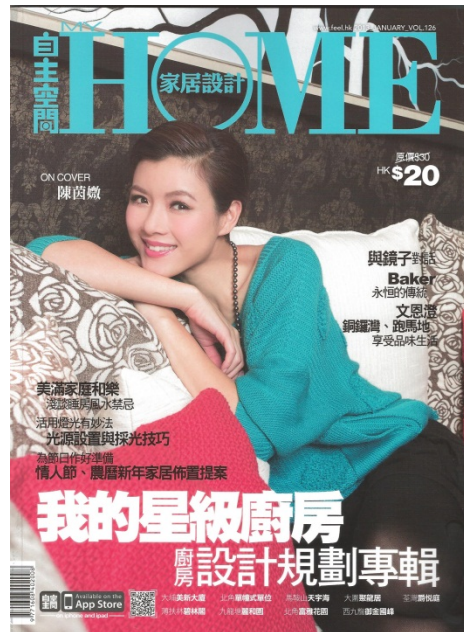
Pokfulam Court featured in My Home Jan 2013