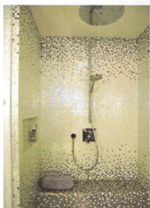
沐浴區的牆身綴以馬賽克，設計獨特。

飯廳設於廚房的旁邊，黑色的餐椅組合配合黑色的造形吊燈，都經過精心挑選，為了迎合女戶主長餐櫃的需要，在餐櫃尺寸與款式上，設計師均下了一翻功夫。為了讓大廳空間變得更寬敞，設計師將原有的主人房納入客廳，廳區以黑、白、灰三色作主調，沙發與電視櫃之間擺放了花紋地毯，提升空間格調，同時作為深淺傢具之間的緩沖區，加強層次感。