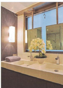
浴室設計簡約，以黑白色作主調，配合柔和燈光，清雅自然。