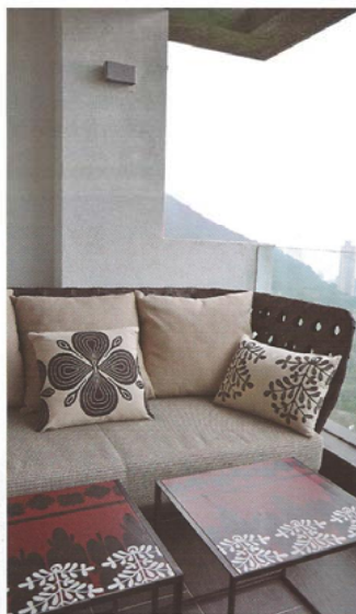
設計師於露台擺放戶外沙發和茶几，為戶提供休閒一角。