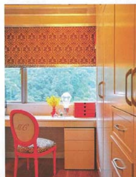
衣櫃間擺放了白色大櫃，窗台位置加設化妝檯。