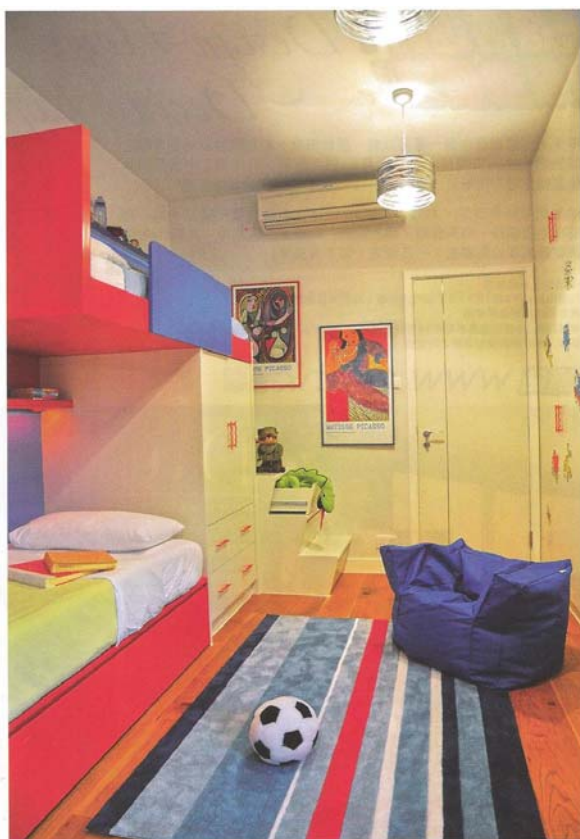
睡房以藍紅兩色作主調，散發活力。