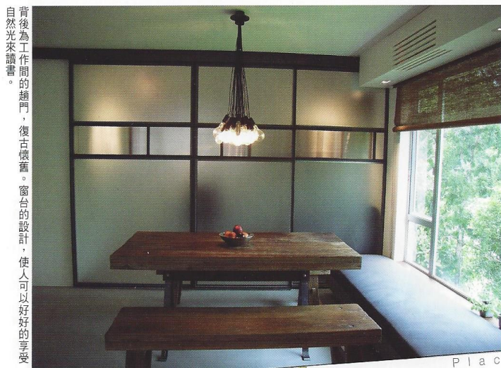
背後為工作間的趟門，復古懷舊。窗台設計，使人可以好好的享受自然光來讀書。