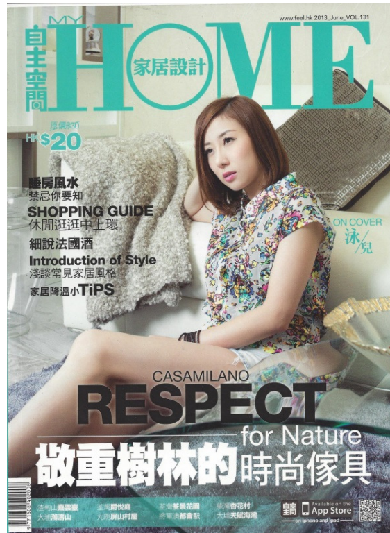
Pingshan Village Hse featured in My Home June 2013