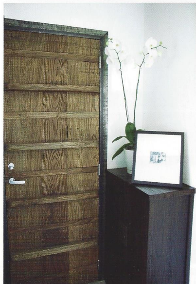
鞋櫃古色古香，讓人想起古時中國。大門設計非常有特色，非平板一塊。