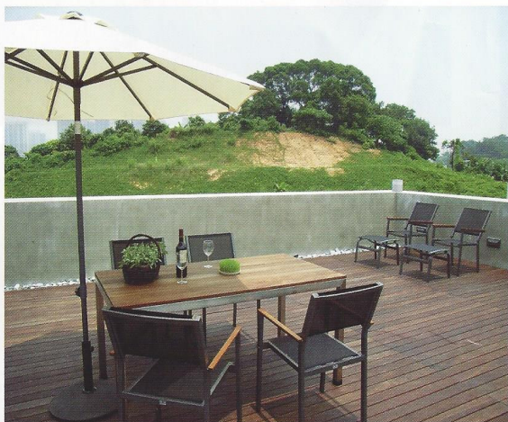
四周以自流平水泥方式鋪至平順，亦在卵石中安設射燈以便晚間照明之用。